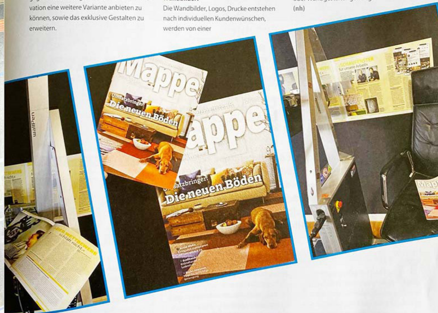
Die Seiten der Mappe wurden eingescannt, der Wall-Pen bringt das Motiv via Tintenstrahl auf die Wand auf. Dazu rollt das Gerät auf einer Schiene und hält so den exakten Abstand zur Wand.

externen Grafik bearbeitet, so dass der umgesetzte Druck inkl. aller Nebenleistungen in der Preisklasse von hochwertigen Tapeten oder Wandgestaltungen liegt. (nh)